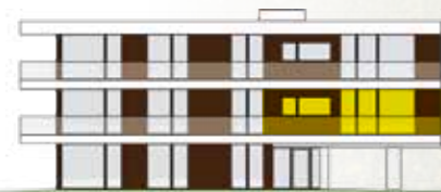
Ansichten Bauteil Ost

Noch in der Projektierungsphase können unsere Kunden die Gestaltung der Räumlichkeiten mit beeinflussen und uns Ihre Wünsche mitteilen, gerne werden wir diese in die Pläne einfließen lassen. Sollten unsere Kunden den Wunsch äußern, 2 Wohnungen zusammen legen zu wollen, sind wir gerne bereit Ihren Wunsch zu erfüllen.