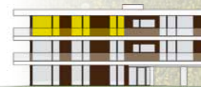
Ansichten Bauteil Ost

Noch in der Projektierungsphase können unsere Kunden die Gestaltung der Räumlichkeiten mit beeinflussen und uns Ihre Wünsche mitteilen, gerne werden wir diese in die Pläne einfließen lassen. Sollten unsere Kunden den Wunsch äußern, 2 Wohnungen zusammen legen zu wollen, sind wir gerne bereit Ihren Wunsch zu erfüllen.